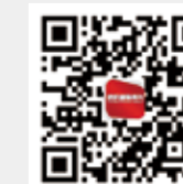
纺织服装周刊 今日头条号