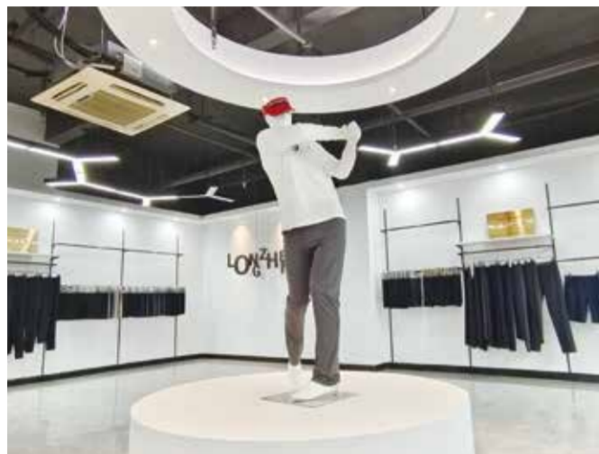
洧正纺织专注于商务休闲男裤面料的研发、生产和销售。