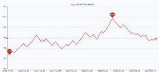
图1 盛泽市场化纤类产品价格指数

据对350家被采价单位反馈的数据监测分析,本周商务部中国·盛泽丝绸化纤指数基本维稳。其中,化纤总指数收盘于98.76点,与上周相比上涨了0.01点;化纤面料价格指数上涨,收盘于98.9点,与上周相比上升了0.13点;化学纤维价格指数小幅下降,收盘于108.62点,与上周相比下降了0.16点。本周蚕茧丝绸类产品价格指数小幅上涨,收盘于106.94点,与上周相比上升了0.04点。