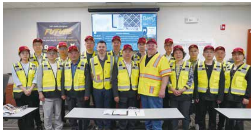
代表团在贝里国际集团斯泰茨维尔工厂合影。

5月8—12日，中国产业用纺织品行业协会代表团在参观北美国际产业用纺织品及非织造布展览会前后，分别赴美国密歇根州底特律市和北卡罗来纳州夏洛特市，参访了AURIA声学实验室、贝里国际集团斯泰茨维尔工厂(Berry Statesville)和Uniquetex公司。