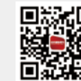
纺织服装周刊 新浪微博