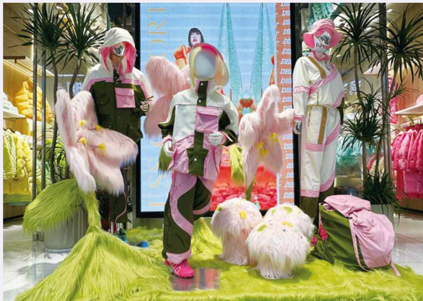
当前，走品牌之路成为纺织企业进一步发展的必然选择。