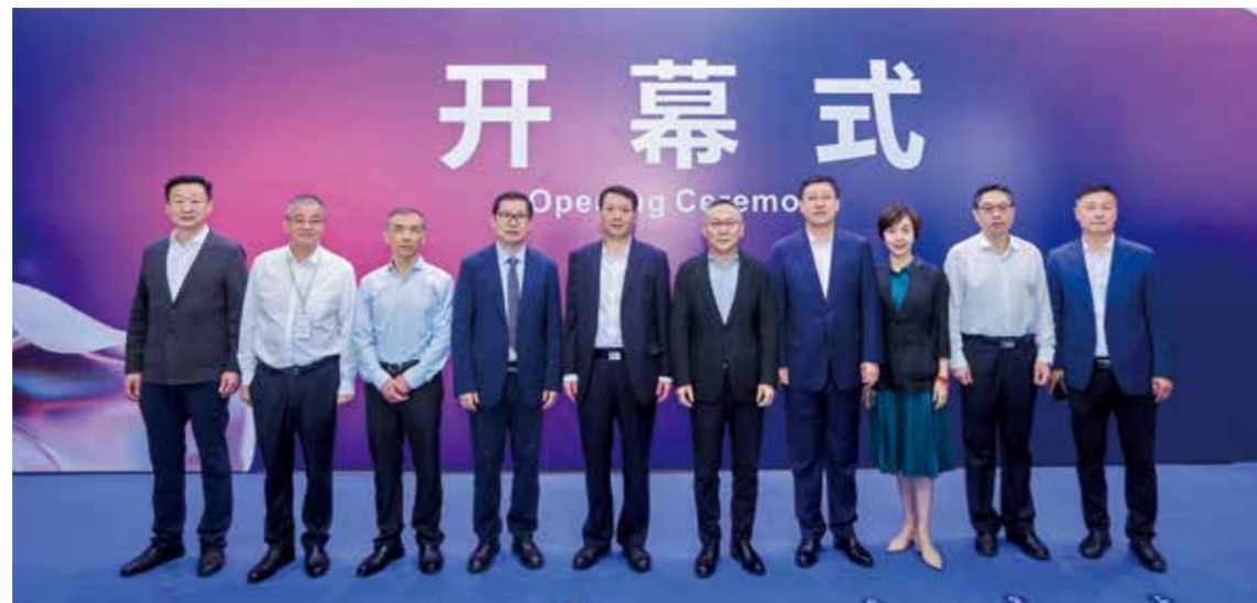
intertextile 面料辅料展-武汉站将以武汉为窗口，为中部地区纺织服装业高质量发展提供有力支撑。

各个展区展品品类齐全，特色产品、创意新品层出不穷，材质、颜色、肌理、花型丰富，广泛适用于服装、家纺、户外、医护等多元场景和应用领域。从宁纺集团的工装系列面料、再升级医护面料、生态环保功能性灯芯绒，到惠辉纺织的无氨弹力针织面料、石墨烯功能面料、生物可降解面料；从康赛妮高端羊绒面料及其他动物纤维混纺面料，到绿锦纺织的纯亚麻梭织染色面料；从杏园达纺织的精纺毛涤现货，到时代梦高达上万种的Stylem面料常规备货；从山木新材料贴肤无感的热转印烫标，到芯仕材料的TPU热熔胶膜……这些产品不仅在抑菌、吸湿排汗、防静电、耐高温、防臭、防紫外线等性能方面不断升级迭代，更是从中部市场真实需求和消费偏好