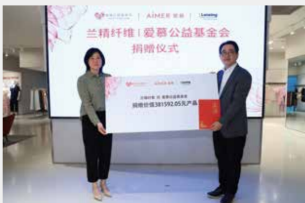
爱慕公益基金会向兰精颁发捐赠证书。

作为全球领先的可持续特种纤维供应商，奥地利兰精集团一直致力于可持续发展战略的实践，努力为全球环保事业和公益事业做出贡献。兰精作为一家高度重视安全、环境、社会责任的企业，促进社区和谐是其“益于自然”可持续发展战略的一个重要基石。多年来，兰精在世界范围内开展参与了多类公益项目。在国外，为改善刚果当地社区生计并保护当地生物多样性，兰精参与支持刚果30万公顷雨林的保护工作；兰精在其最大的泰国莱赛尔工厂，积极参与当地红十字会捐款和献血活动等。在国内，2021年兰精和