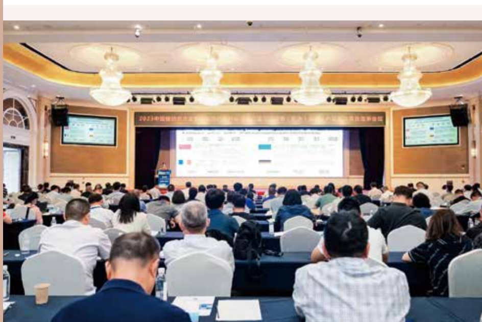
2023 中国棉纺织大会深入探讨中国式现代化在棉纺织行业的落地实践。