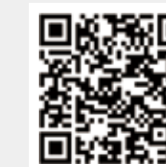
纺织服装周刊 网易号