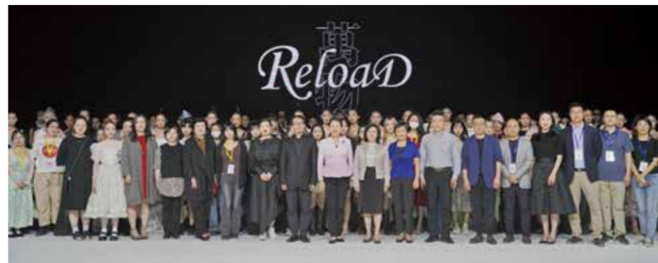
与会领导与毕业生合影。