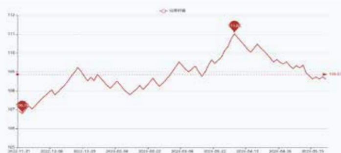
图2 盛泽市场化学纤维指数走势

本周以来,涨跌互现,整体较上周略有反弹。欧佩克减产、俄罗斯减产、美国产量放缓和战略库存回购是今年油价下方主要支撑。本周美国能源部官员表示,6月结束今年的2600万桶战略库存抛售后,下半年可能会逐渐启动收储,但具体时间和数量尚不确定。目前美国战略和商业油品总库存已降至四十年低位,如果开启收储相当于额外补充原油需求。截至5月18日收盘,纽约商品交易所6月交货的轻质原油期货价格下跌0.97美元,收于每桶71.86美元,跌幅为1.33%;7月交货的伦敦布伦特原油期货价格下跌1.10美元,收于每桶75.86美元,跌幅为1.43%。